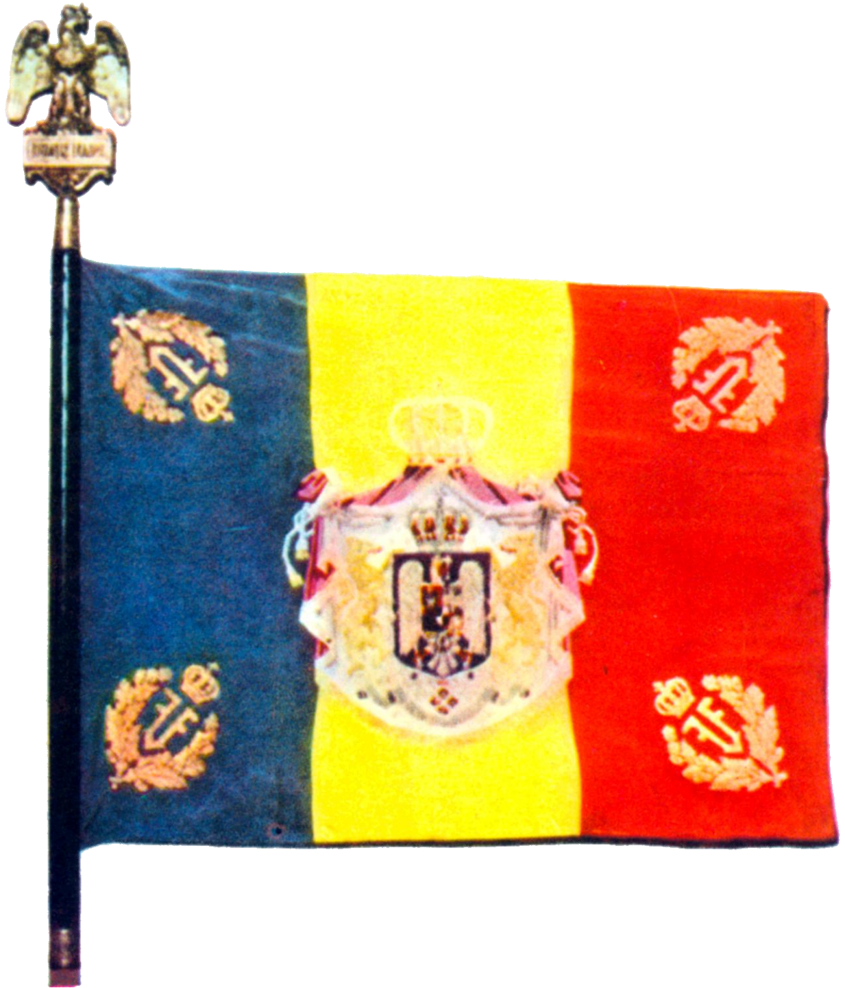
Drapel al armatei române în perioada 1938-1944