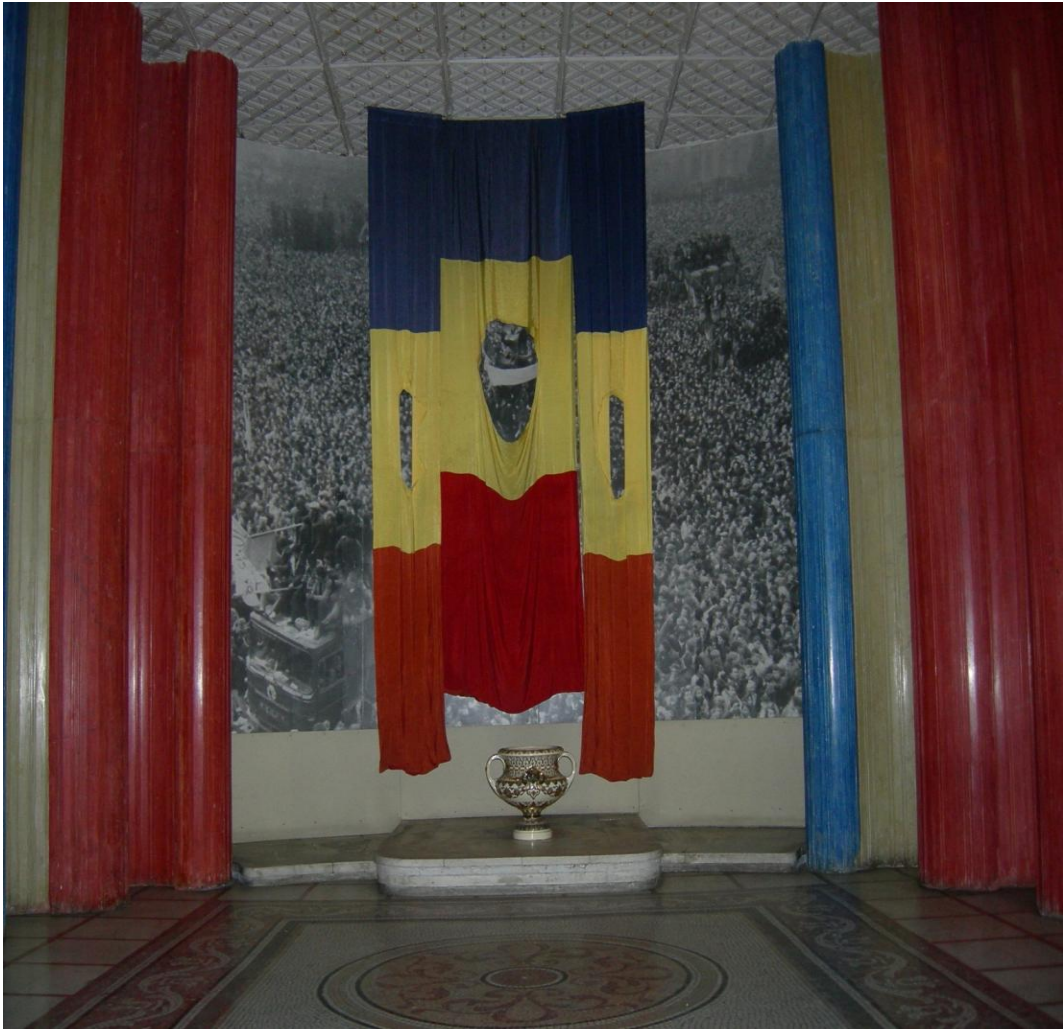
STEAGUL REVOLUȚIEI DIN DECEMBRIE 1989