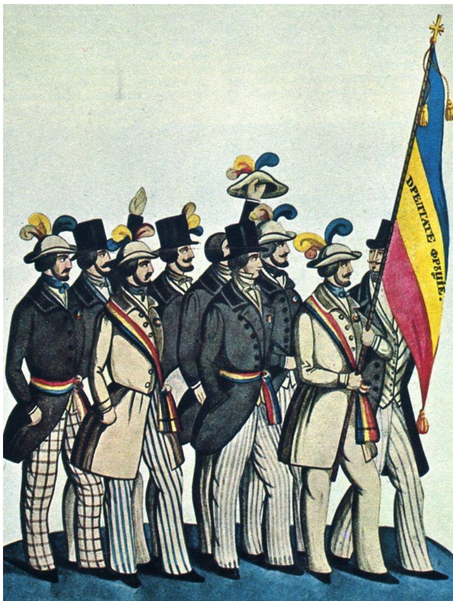
DRAPELUL REVOLUȚIEI DE LA 1848