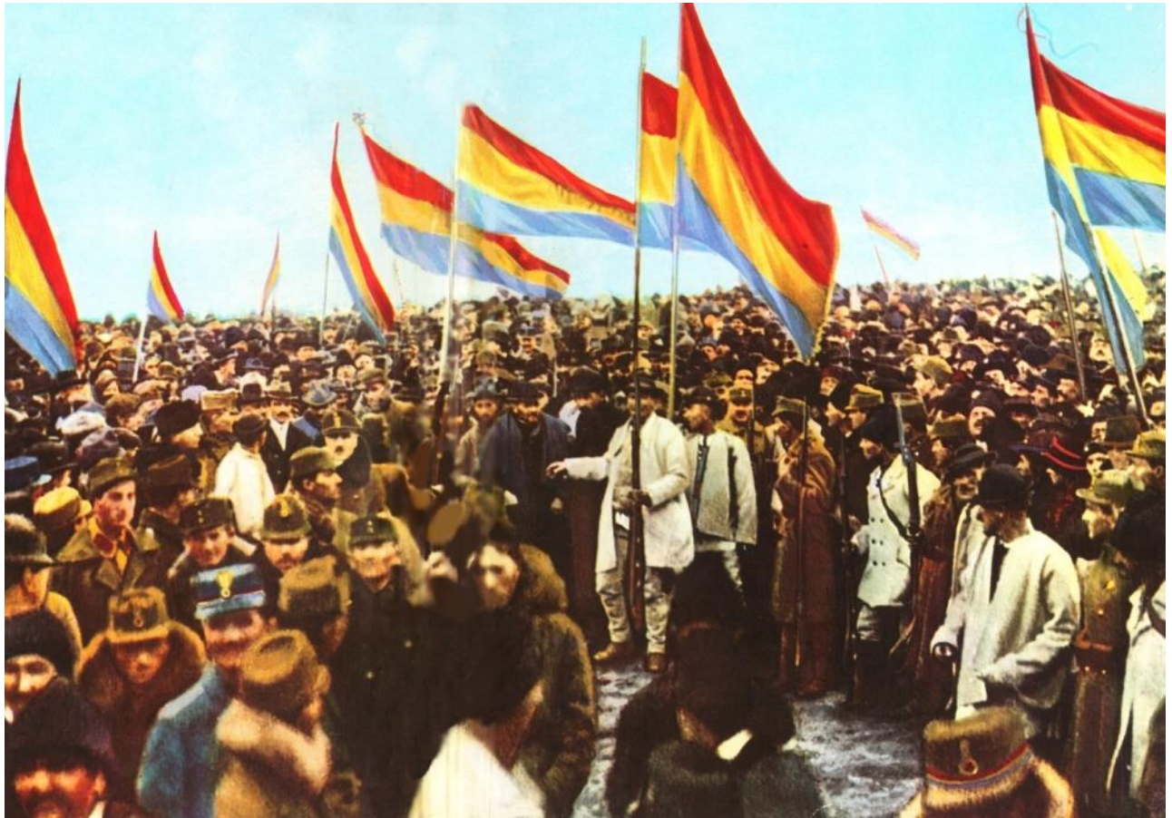
ADUNAREA NAȚIONALĂ DE LA 1 DECEMBRIE 1918, ALBA-IULIA